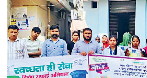
सीवन। स्वच्छता जागरूकता रैली निकालते नगर पालिका के कर्मचारी।