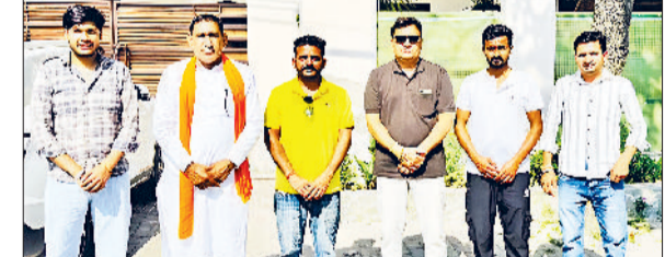
राजौद। गांव जाखोली में बैठक में भाग लेते।