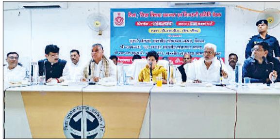
जीद। बैठक की अध्यक्षता करते हुए सांसद कुमारी सैलजा, सांसद जयप्रकाश व सांसद सोनीपत ब्रह्मचारी व बैठक में मौजूद लोग।