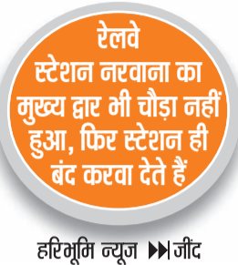
हरिभूमि न्यूज | जीद