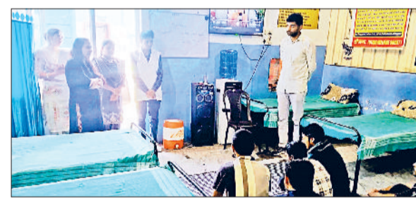
जीद। निरीक्षण करते सीजेएम।