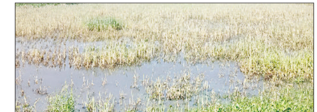
राजौद। खेतों में गंदा पानी भरने से किसान की खराब हुई गेहूँ की फसल।