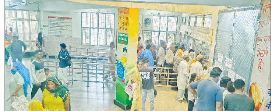
जींद। नागरिक अस्पताल में ओपीडी रिलय के लिए लगी लाइन।