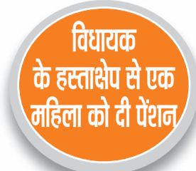
हरिभूमि न्यूज अलेवा