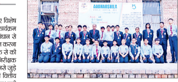
जीद। प्रतियोगिता में स्वर्ण पदक विजेता बच्चे।