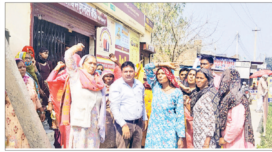
अलेवा। नगरां गांव स्थित पंजाब नेशनल बैंक के सामने नारेबाजी करती डाहौला गांव की महिलाएं।