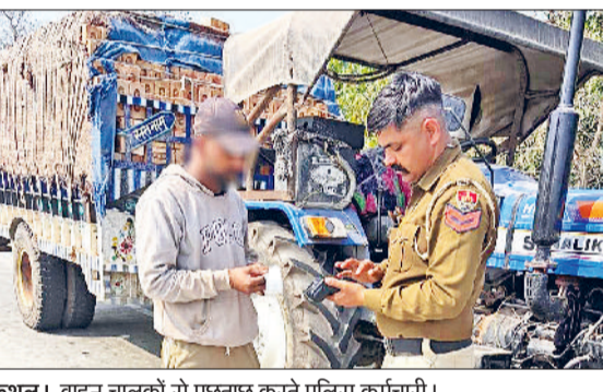
कैथल। वाहन चालकों से पूछाचछ करते पुलिस कर्मचारी।