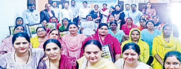
जीद। महिलाओं को सम्मानित करते हुए।