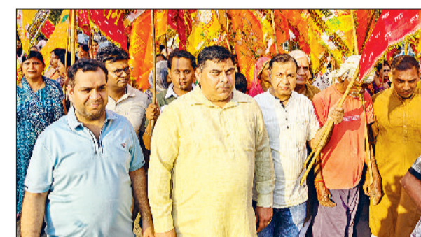
पूडरी। निशान यात्रा में भाग लेते हुए श्रद्धालु।

पूडरी में श्री श्याम परिवार ट्रस्ट पूडरी की ओर से शुक्रवार शाम श्री खाटू श्याम निशान यात्रा बड़े ही श्रद्धा और उत्साह के साथ निकाली गई। यात्रा की शुरुआत रघुनाथ मंदिर से हुई और यह मुख्य बाजार से होती हुई शनिवार को अनाज मंडी में होने वाली श्री खाटू श्याम फाल्गुन विशाल महोत्सव स्थल पर पहुंचकर संपन्न हुई। निशान यात्रा के दौरान बड़ी संख्या में श्रद्धालु हाथों में श्याम बाबा के निशान लेकर पैदल चल रहे थे और पूरे मार्ग में